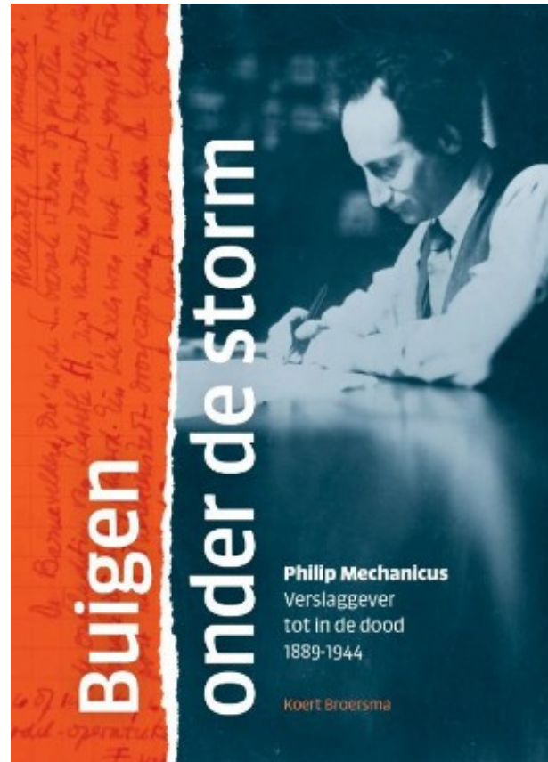
2de herziene editie, 2019