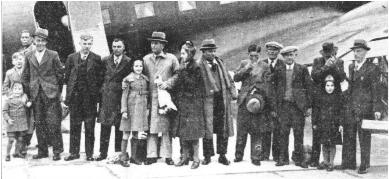
Overlevenden van de 'Den Haag' bij terugkeer in Nederland, Schiphol, 26 februari 1940.